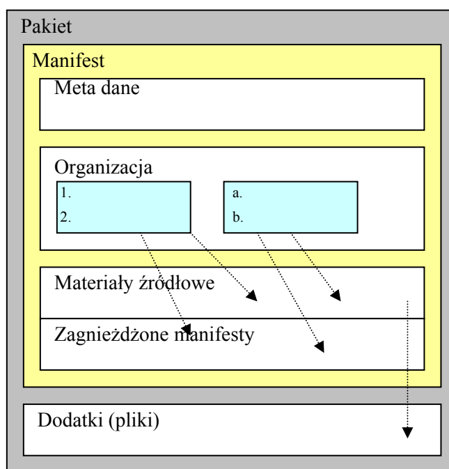
Rys. 3. Schemat pakietu IMS / SCORM.

Obecnie kilka organizacji zajmuje się tworzeniem propozycji standardu do opisu treści e-kursów. Należą do nich: Aviation Industry CBT Committee (AICC), IEEE Learning Technology Standards Committee, IMS Global Consortium, Advanced Distributed Learning (ADL) – SCORM (Sharable Content Object Reference Model). SCORM nie tworzy nowych standardów ale adoptuje najlepsze rozwiązania innych pomysłodawców. Dlatego wiele z zaleceń SCORM pokrywa się z tym co proponuje AICC czy IMS. Dzięki jednak takiemu postępowaniu standard SCORM jest obecnie najszerzej wpieryanym standardem.